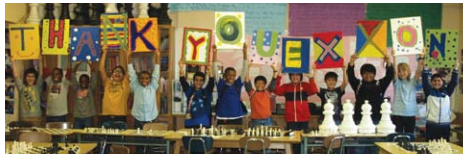
Miembros del equipo de ajedrez de IS 318 expresan su aprecio por el apoyo de ExxonMobil.

Como parte de nuestro compromiso con Greenpoint, ExxonMobil apoya programas en algunas escuelas locales. Un muy digno receptor de nuestro apoyo es IS 318, la escuela Eugenio Maria de Hostos, para los grados del 6° al 8° en Williamsburg. El año pasado, ExxonMobil fue invitado a asistir a la proyección del documental “Brooklyn Castle”, que hace una crónica del extraordinario éxito del equipo de ajedrez IS 318. Estos increíbles logros de estos estudiantes y sus dedicados maestros nos conmovieron tanto que ExxonMobil, junto con Broadway Stages, Town Square y la Cámara de Comercio de Brooklyn, decidieron auspiciar la proyección de la película para recaudar fondos para programas extracurriculares en IS 318. (continúa en la página 3)