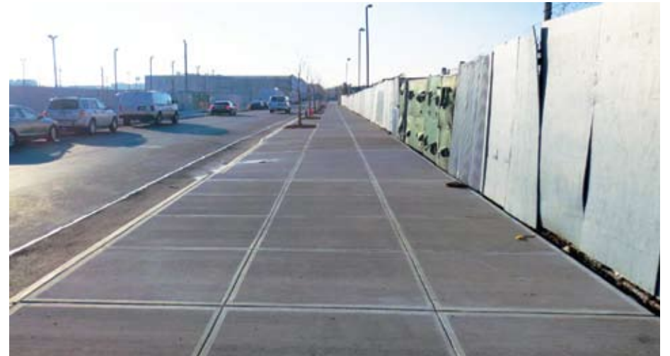
Vista de la nueva acera de Monitor Street