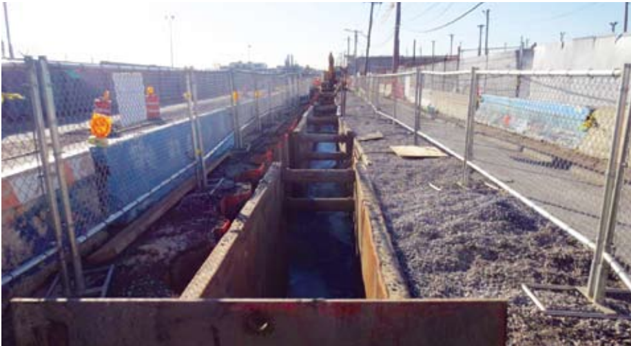
Excavación de zanjas y apuntalamiento completados en la preparación para las mejoras del nuevo drenaje pluvial.

a Greenpoint como un excelente lugar para vivir y trabajar. Esperamos que el drenaje pluvial y las mejoras en la acera de Monitor Street sean un beneficio duradero para la comunidad.